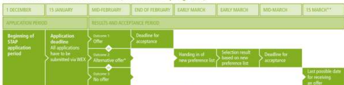
STAP Master – main selection round (fall term and spring term)

Sollten nach Abschluss der main selection round Plätze frei geblieben sein, wird im Mai eine weitere, kleine Bewerbungsrunde (secondary selection round) angeboten.